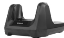
Зарядная станция (Cradle)