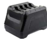
4-х зарядная станция для батарей